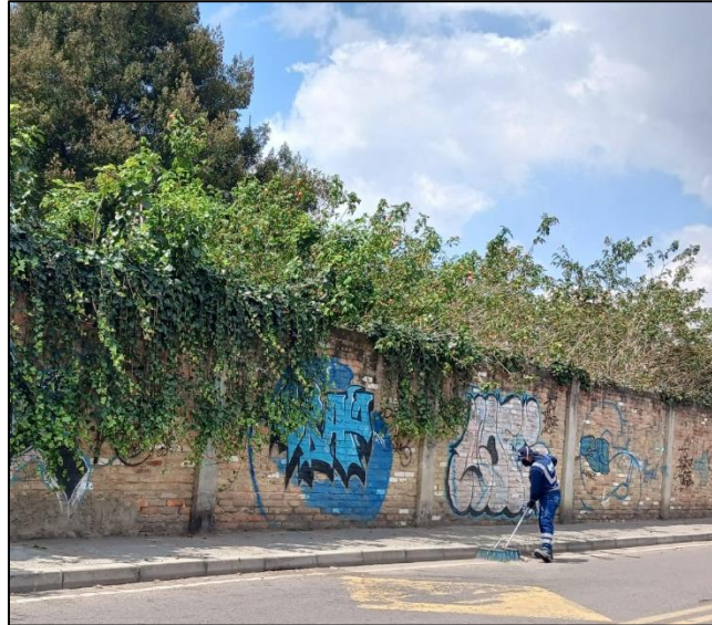
Imagen 4. Actividad de barrido EMAAF

Con base en lo anterior, se realizarán sensibilizaciones con la comunidad ubicada en el área de influencia, referente a gestión integral de residuos sólidos, tenencia responsable de mascotas y Código de Policía, con el fin de concientizar a la población y promover comportamientos en buenas prácticas habitacionales para una sana convivencia.