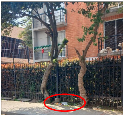
Imagen 1. Residuos sólidos en andenes

De acuerdo al asunto de referencia y dando a la queja interpuesta respecto a la presencia de residuos sólidos y excrementos de perros en la calle 20 entre carreras 2 y 5, se le informa que el día 3 de enero, se realizó recorrido de verificación, como consta en acta de visita ambiental No. 002 anexa al presente, evidenciándose residuos sólidos, principalmente papeles y empaques plástico en andenes y borde de vía, una lona en la calle 20 entre carreras 2c y 3 y acumulación de bolsas de basura en la esquina de la calle 20 con carrera 3.