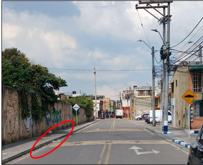
Imagen 3. Disposición de lonas y acumulación de bolsas de basura